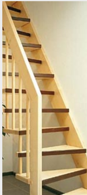
Treppe mit Wandwange